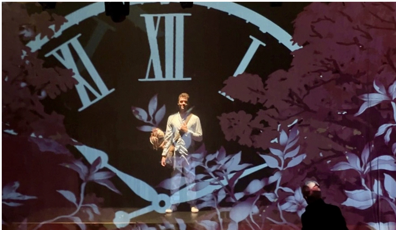
Photo de répétition de Kain