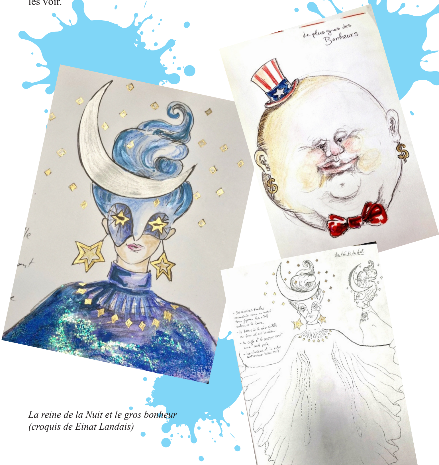
La reine de la Nuit et le gros bonheur (croquis de Einat Landais)

L'usage des marionnettes et de techniques de manipulations variées, souligne la grande théâtralité d'un texte qui se joue de la réalité. Le monde matériel et les pensées que l'on côtoie chaque jour s'animent, changent d'échelle, prennent corps et se révèlent à qui veut les voir.